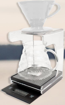
V60 Dripper V60 Brew Kit

Pour Over demleme yöntemi V60 Dripper, V60 Server ve Drip Station'dan oluşur. Ayrı ayrı olarak da satılmaktadır.