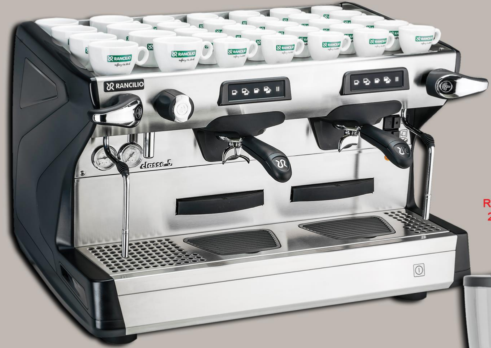
Rancilio Classe 5 2 Grup, Tall Cup

Rancilio KRYO 65 On Demand Dozaj Kontrollü Değirmen